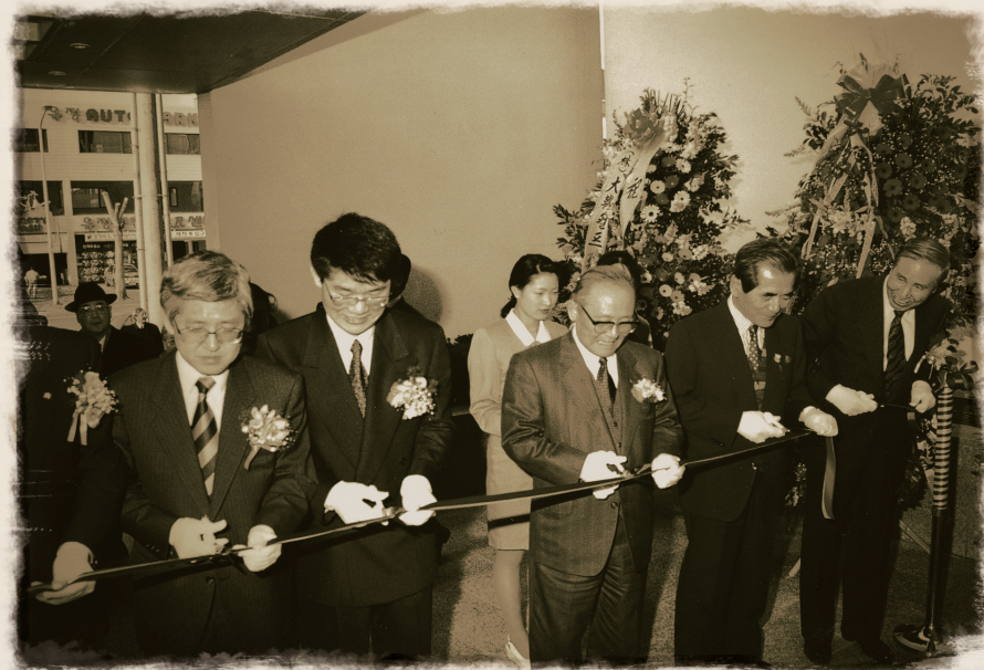
1993 강남미즈메디병원 개원식