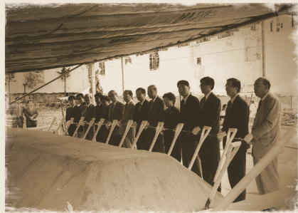
1998 강서미즈메디병원 기공식

아기와 여성만을 위한 미즈메디병원의 역사는 대한민국 여성전문병원의 역사가 될 것입니다.