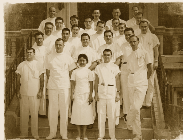
1955-1956 Allentown State Hospital에서 직원들과 함께