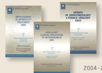
2004-2005 미즈메디병원 주최 심포지움

The 10th Symposium <GENE & Diet Clinical Application of Nutrigenomics>