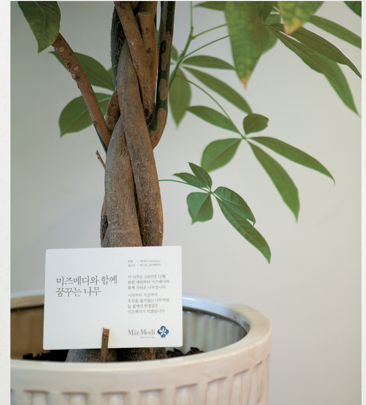
Memory Pot since 1993

미즈메디에는 생명의 역사를 함께 지켜온 나무가 있습니다. 1993년 12월 강남미즈메디병원이 진료를 시작하는 날부터 함께 자라온 파키라 나무는 생명의 에너지와 꿈을 품고 미즈메디를 방문하는 고객들을 맞고 있습니다. 이 나무는 18년간 초심을 잃지 않고 강인하게 지켜나가는 미즈메디의 푸른 메시지를 전하고 있습니다.