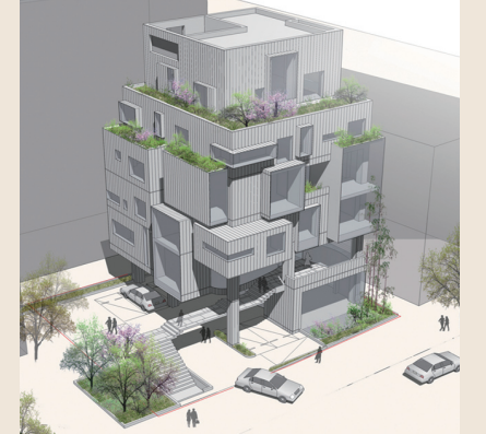
위·2010 강서미즈메디병원 신관