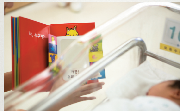
the First Book